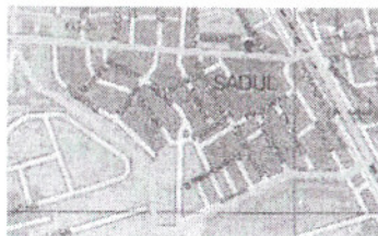
Granica Osiedla Sadul przebiega

osią ul. Lucerny od jej zbiegów z Kanalem Wawerskim do torów kolejowych wzdłuż torów kolejowych do linii wysokiego napięcia biegnąca do elektrociepłowni Siekierki wzdłuż linii wysokiego napięcia biegnąca do elektrociepłowni Siekierki do Kanalu Zagożdżńskiego do ulicy Lucerny